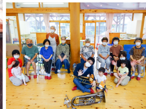
保育と交流(魚梁瀬)

この2つの事業のコーディネーターは、地域に住むすべての人が自立して生活できるよう、各関係機関と連携をとりながら、生活全体をコーディネートする役目をしています。