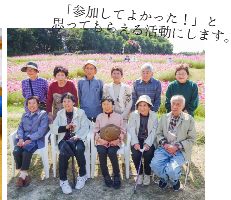
おどかけ(奈半利町)