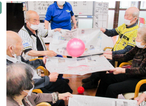
レクリエーション(秋の運動会)