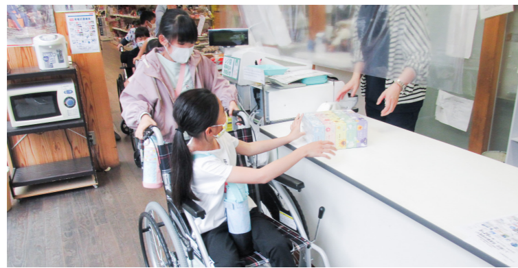
車いすご購入物体験