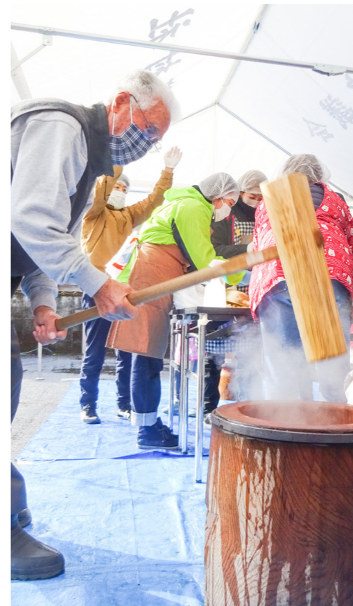
地区のイベント(もちつき)

あったかふれあいセンターと生活支援体制整備事業は、住民のみなさんの集いの場作り、地域の見守り体制づくり、個別の訪問、生活支援、介護予防(百歳体操)を行い、生活に直結した活動をしています。