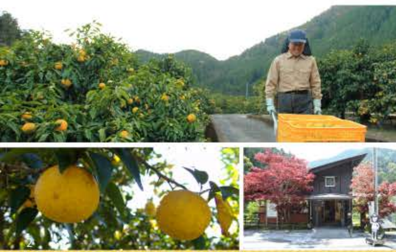
堂々たる田舎×仕事にフォーカス 馬路村地域おこし協力隊 飯田 明里