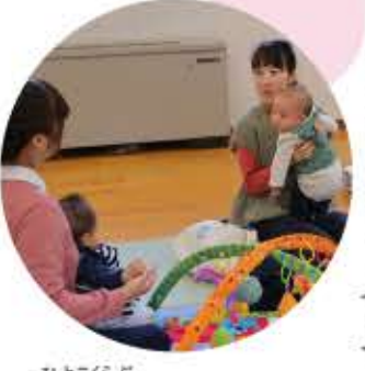
ひよこらぶ 保育所に入るまでの赤ちゃんとお母さんの集いの場。週1回程度集まって、皆でお茶を飲んだり、お話をしたり。お母さんたちの貴重な情報交換の場になっている。

— 以前インタビューした際は、村内に家を建てたいということでしたが、その後のかがですか? 昨年(17年)の10月に建てました!でも、念願のマイホームって言うよりは、子どもたちと一緒に過ごすための「箱」として建てた感じ。村には保育所と小中学校はあるけど、高校がないので、この子たちと濃い時間を過ごせるのが、大体あと10年くらいと考えると、日常を少しでも豊かにしたいなって思っています。 — 実際に村で子育てをしてみても感じたことを教えてください。 自分だけが教育者じゃないって感じがする。家族だけじゃなくて、村の人みんなに子育てを見守ってもらっているっていう感覚かな。筍の皮を剥いたり、きゅうりの害虫を取ったり。そういう環境が身近にある。お母さん同士の情報交換もできるし、何かあったら周りにいる先輩ママに聞くことができるしね。保育所に入るまでは「ひよこらぶ」があるから、家に引きこもらずに出かけるきっかけにもなるし!(笑)