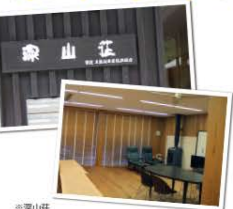
※深山荘 馬路村農協の独身寮。7つの部屋と家族や友人用の宿泊棟、そして「夢を語りあうための部屋」がある。今回の座談会の会場としてお借りした。