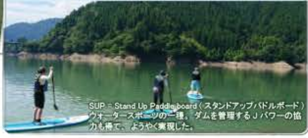
SUP = Stand Up Paddle board (スタンドアップ/パドルボード) ウォータースポーツの一種。ダムを管理するJパワーの協力も得て、ようやく実現した。

AM 10:00 SUP (サップ) 西尾さんは魚梁瀬ダムのダム湖を活用した新しいアクティビティ“SUP (サップ)”の体験。ボードの上に乗って、パドルを漕いでみんなで水上散歩。波がない湖面は初心者でも安心して楽しめる。